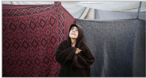
هوای بارانی - غزه