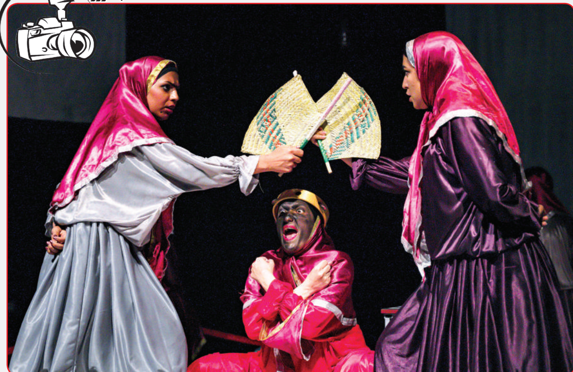
نمایش لیر خوانی