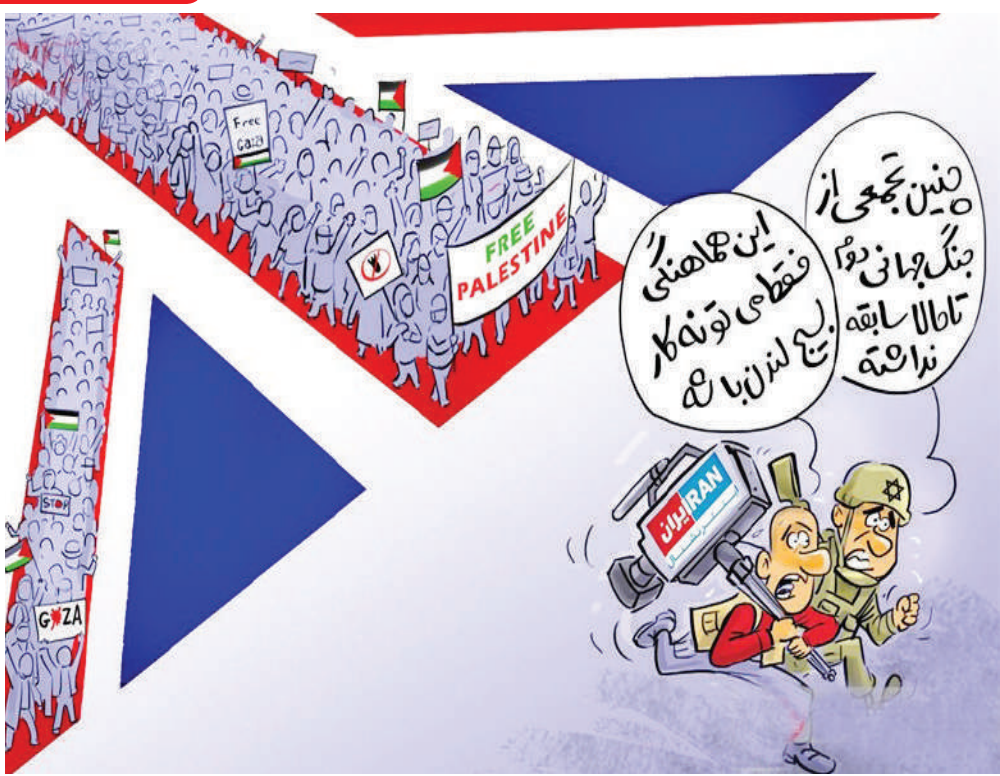
کاریکاتور - برک BBC و اینترنشنال پرید؛ تظاهرات ۵۰ هزار نفری حامیان فلسطین در لندن