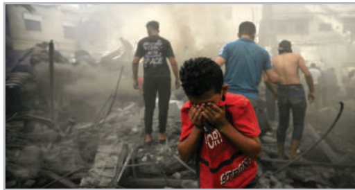
جنایات رژیم صهیونیستی - خان یونس