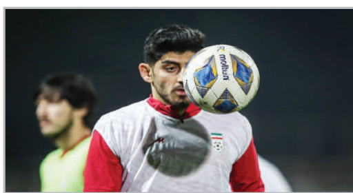
تمرین تیم ملی فوتبال