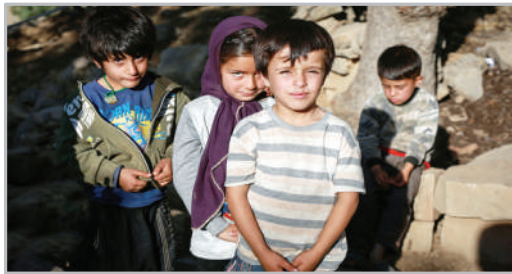
مرسه عشایری «بازفت»