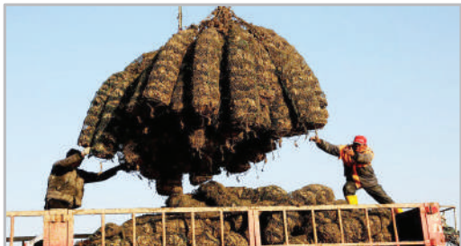
صدید صدف از سواحل اقیانوس آرام - چین